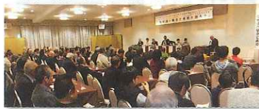
▲パネルディスカッションの様子 小学生・中学生もパネラーとして堂々と発言