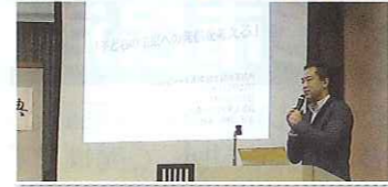
◀講演をする「大崎不登校を考える会」代表: 高橋 雅道氏 テーマ: 「子どもの未来への発信を考える」